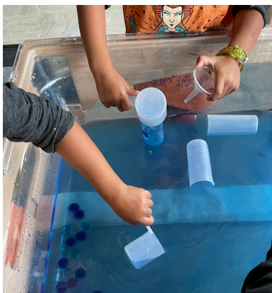
Mesa de agua