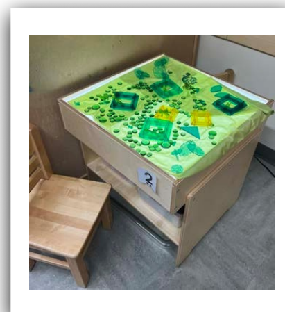
Mesa de luz