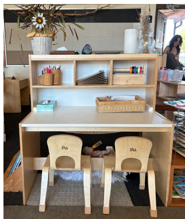
Centro de mensajes